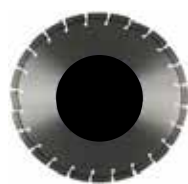
DISQUE BETON 350